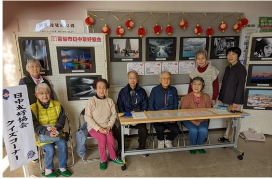
皆さん、ご協力ありがとうございました